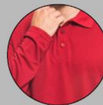
Cuello y Mangas con Cárdigan